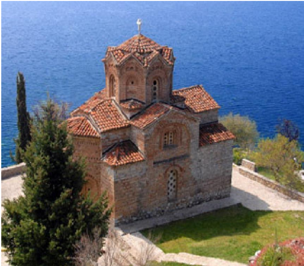
St John Kaneo - Ohrid, Macedonia, 13th century Свети Јован Канео – Охрид, 13ти век